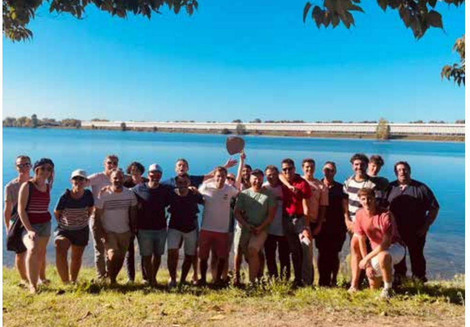
Du simple défi au succès : la section BEER / Erronkatik arrakastara: BEER saila

BEERen hiru talde daude: 35 urtetik gorakoak, 35 urtetik beherakoak eta atal femenino/misto bat. Akitania Berriko Errugbi Ligako Burdi Five txapelketan ere parte hartu zuen. 2023ko ikasturtearen hasieran Villenave-d'Ornongo Trigan estadiora aldatu dira. Errugbi klasikoko entrenamenduak asteazken arratsaldero egiten dira, eta hilean behin Burdi-a. BEER ez da zelaian jokatzeraz mugatzen, Euskal Etxean errugby txapelketak ikusteko ekitaldiak antolatzen dituzte ere bai. Gainera, maiatza-ekaina aldera, sailak txapelketa handi bat antolatu nahi du Villenave-d'Ornon-en, nazioarteko taldeak gonbidatzeko helburuarekin, Espainiako euskal taldeak barne.