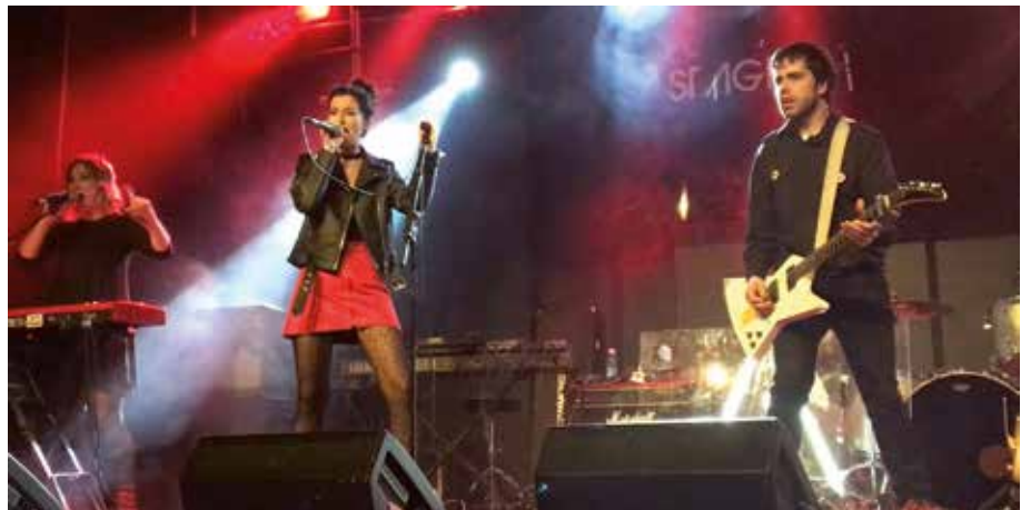
Le groupe guipúzcoan Anita Parker / Anita Parker talde gipuzkoarra