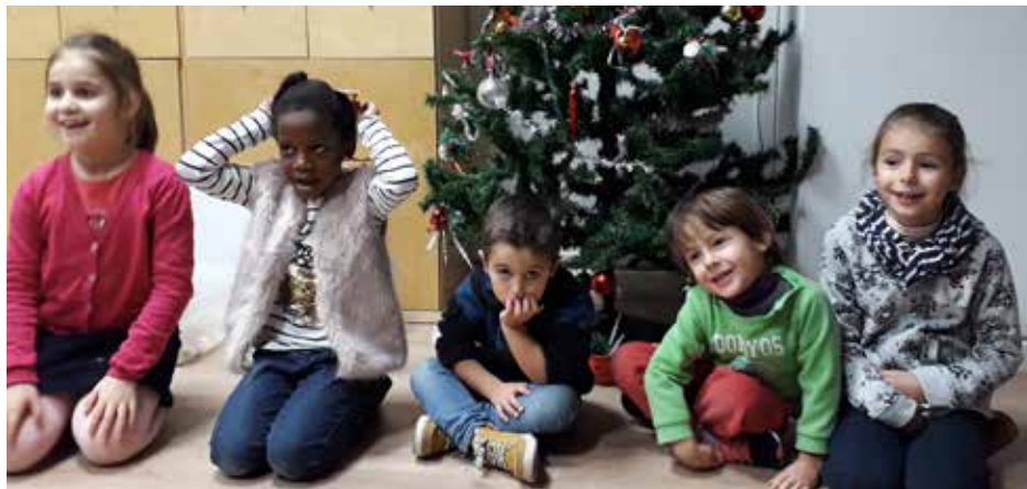
Les enfants de la section Haurrak Euskaraz dans l'attente d'Olentzero, après avoir préparé le sapin de Noël / Haurrak Olentzeroren zain Eguberriko izeia prestatu ondoren

Cette année encore, depuis le mois de septembre, nos petits élèves de la section Haurrak euskaraz viennent une fois par semaine à la Maison Basque, le samedi matin de 10 h 30 à 11 h 30. Nos élèves sont des garçons et des filles entre 4 et 8 ans qui, grâce à des activités variées, découvrent la langue basque ou progressent dans sa maîtrise. Nous avons organisé le programme de 2018-2019 en quatre périodes : automne, Noël, hiver, printemps. Durant le mois de décembre, nous avons appris le lexique lié aux fêtes de Noël et réalisé des activités manuelles (dessins d'Olentzero,