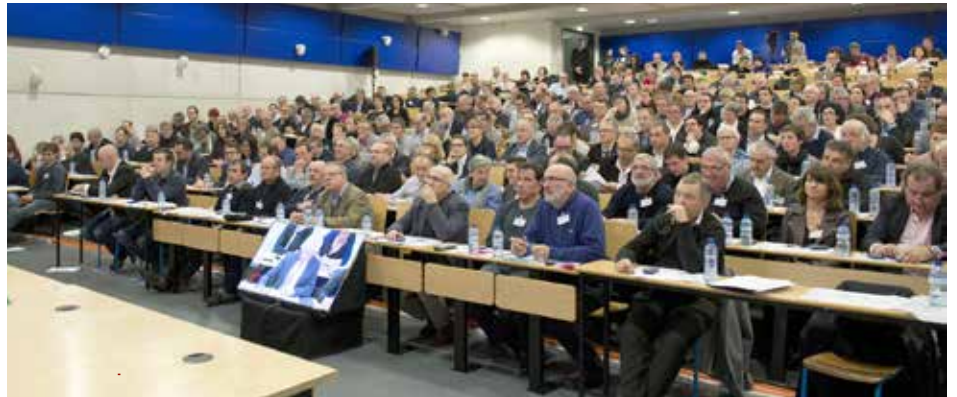
Les élus de la Communauté d'agglomération Pays Basque / Euskal Hirigune Elkargoaren hautetsiak

Pixkanaka-pixkanaka, administrazioaren esparruari buruzko aintzinamenduak eginen dira; alta Iparralde Biarnotik bereizteko ideia baztertua egoiten da. Hainbat hitzarmen sinatuak dira Estadua eta Iparraldeko hautetsien artean, Batera plataformaren egintza ahanzi gabe, eta horrek guziak bururapen ofiziala 2008an aurkituko du François Fillonek sinaturiko Euskal herri lurralde kontratuarekin. Hala bada, erran dezakegu Herrien arteko lankidetzarako erakunde publikoaren sormena, herriek 2016an bozkaturik, eta gero Euskal Hirigune Elkargoarena 2017an, hainbat mendez iraun zuen prozesu korapilatsu baten ondorioa dela. Lurraldeko hamar herriarteko elkargo bateratzen dituen Euskal Hirigune Elkargoa 2017ko urtarrilaren 1ean sortu da. Euskal Hirigune Elkargoan ondoko zenbakiak nabarmendu behar ditugu: 1 150 langile, 233 elkargo kontseilari, 140 ordezkari, 158 herri, 300 000 biztanle, Akitania Berriko 2. biztanle eremua. Institutio horrek eskumen andana baditu (antolaketa eta bizilekuak; mugazgandiko lankidetzak; ura, saneamendua, itsasbazterra eta natura guneak; ekonomia, goi mailako irakaskuntza eta turismoa; mugikortasuna; mendia; prebentzioa, hondakinen bilketa eta tratamendua; hizkuntza politika; heritarrei zerbitzuak; trantsizio energetiko eta ekologikoa; kultur partaidetza) eta Euskal Herriko garapenaren aldeko eragile nagusienetariko bat da.