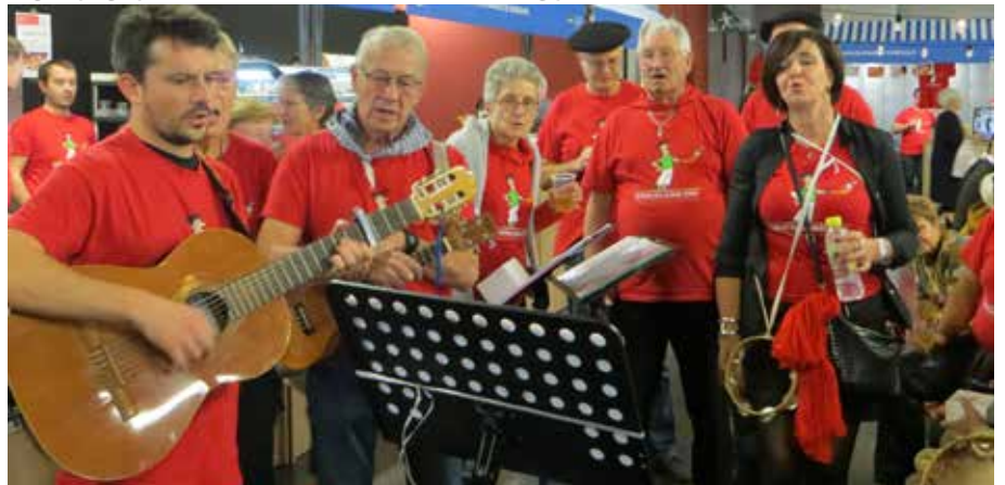
Le groupe d'animation Kantuz / Kantuz animazio taldea