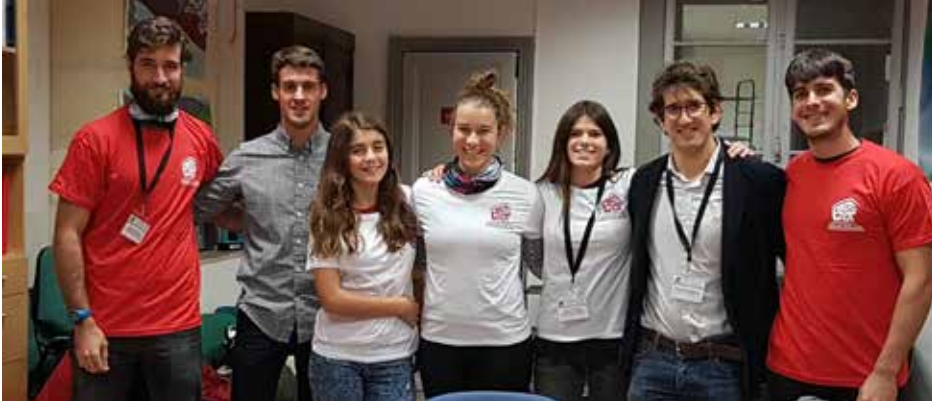
Les étudiants venus de Madrid accueillis à la Maison Basque / Euskal Etxeak hartu zituen Madrilgo ikasleak

La Maison Basque de Bordeaux a été sollicitée pour participer à un séminaire étudiant international qui s'est tenu en parallèle du colloque international « Héritage sportif et dynamique patrimoniale » (14 e Carrefour d'histoire du Sport de la Société française d'histoire du sport et 22 e conférence du Comité européen d'histoire des sports).