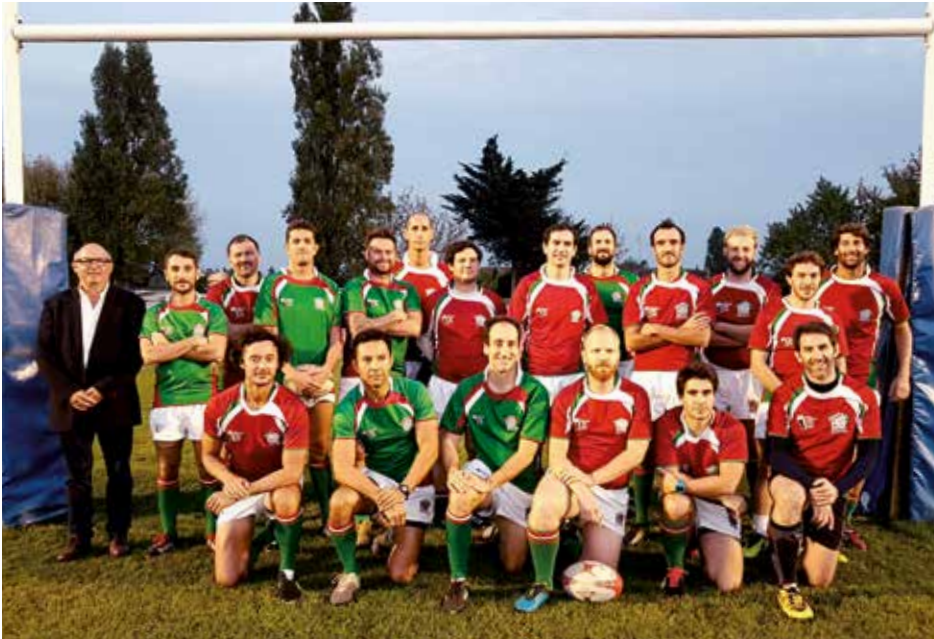
Janvier 2019, une partie de l'équipe de rugby de la Maison Basque de Bordeaux / 2019ko urtarrila, Bordaleko Euskal Etxeko errugbi taldearen parte bat

de l'instruction physique de la Gironde et est promu au grade de colonel. Comme de nombreux Basques, ses exploits sportifs avaient commencé en jouant à la pelote pour ensuite faire une grande carrière rugbystique au SA Mauléon, qui se poursuivra à la Section paloise après la Première Guerre, équipe dont il devint capitaine en 1920. Par la suite, il embrassera une carrière de dirigeant de rugby. À Bordeaux, il était membre du Comité Côte d'Argent de Rugby et fut dirigeant à la Fédération française de rugby. Il s'impliquera dans la vie politique bordelaise en devenant