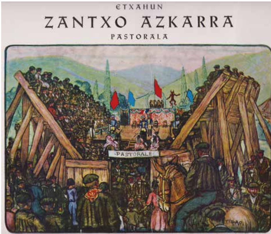
Livret de la pastorale « Zantxo azkarra » d'Etxahun (1973), disponible sur demande à la Maison Basque / Etxahunen "Zantxo azkarra" pastorala (1973), eskuragarri Euskal Etxean