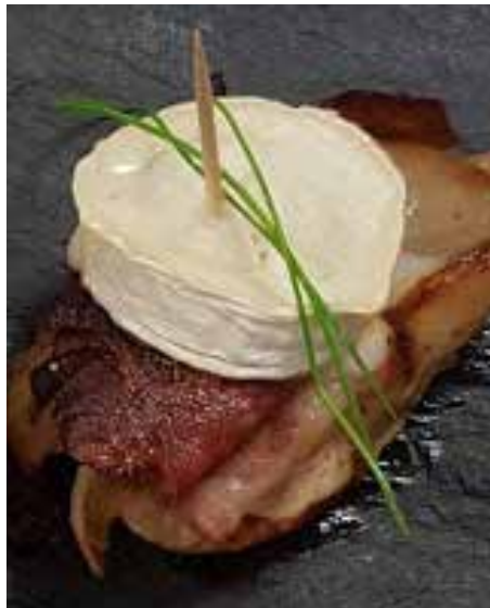
Le pintxo endives braisées au lard proposé par Mathilde lors de l'atelier Goxoki / Mathildek proposatutako pintxoa, endibia errea eta gizona