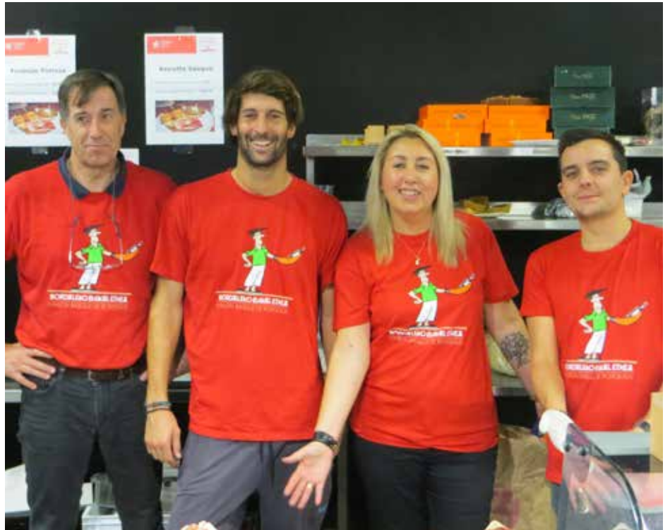
Des bénévoles sur le stand de la Maison Basque / Bolondresak Euskal Etxeko erakusmahaiari

A près une première participation à l'opération Bordeaux S.O Good en 2017, au cours de laquelle nous avons notamment constaté que de nombreux Bordelais découvraient notre association, la Maison Basque a tenu un stand au Hangar 14 les 17 et 18 novembre 2018. D'une taille conséquente, puisqu'il était le plus grand avec celui d'Ogeu – hors l'espace des ateliers culinaires bien entendu –, il comprenait une partie culturelle et une offre bar et pintxos. Notre partenaire Accoceberry, charcutier traiteur d'Espelette, était à nos côtés. Ce stand faisait partie d'un pack négocié avec les organisateurs (CCI de Bordeaux), incluant d'autres éléments tels que communication, animations et Pass Privilège.