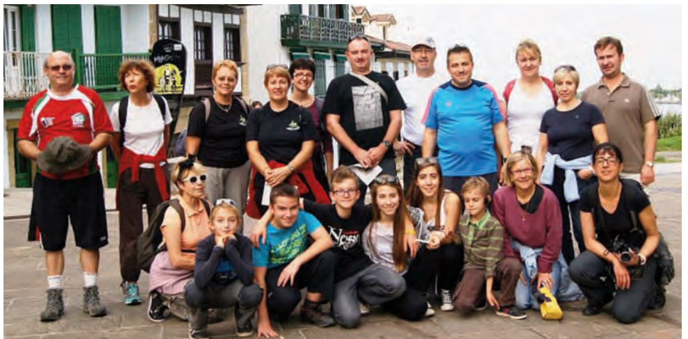
Les randonneurs de la section Ibilki à Fontarrabie le 19 octobre Ibilki sailaren txangozalean, Hondarribian, urriaren 19an.

Un objectif est atteint pour Ibilki avec cette première sortie au Pays Basque. Rendez-vous est pris pour l'année prochaine afin de découvrir un autre endroit de notre magnifique Pays.