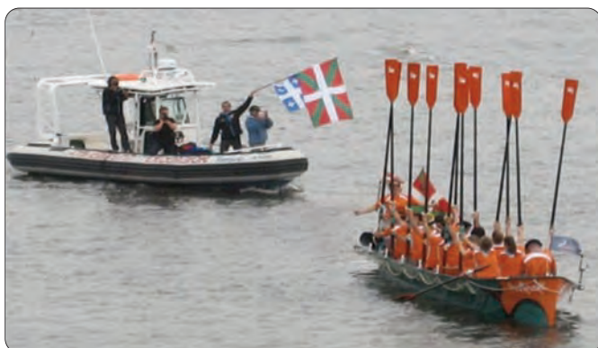
L'équipage de la traînière « Indianoak » sur le fleuve Saint-Laurent au Québec « Indianoak » traineruaren arraunlariak Saint-Laurent ibaian, Québec-en.

Mais il est arrivé aussi qu'ils n'accostent pas là où on les attendait. Nous les avons vus revenir de la boue jusqu'aux genoux, souffrant d'ampoules et gerçures aux pieds, aux mains mais surtout aux fesses, ne sentant plus leurs épaules ni leur dos. Le percussionniste-chanteur est kiné ; il devient le