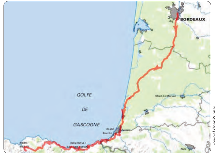
Le parcours / Ibilbidea

Aussi, l'hébergement et la restauration sont pris en charge dans l'organisation de la randonnée. Pour chacun des trois jours, le ravitaillement des cyclotouristes est prévu à mi-parcours : Commensacq pour la première étape, Bassussarry pour la deuxième et Ondarroa pour la troisième. À Léon, le Village-sous-les-Pins mettra à notre disposition des bungalows de 2, 4 ou 6 personnes dans un cadre forestier. Un restaurant sur le site accueillera un dîner animé par un groupe de musique traditionnelle. À San Sebastian, une auberge récemment construite dans le parc d'Ametagaña (4 km du centre-ville) nous recevra dans des chambres de 2, 4 ou 6 personnes. Ici encore, un dîner animé sera organisé dans le restaurant du lieu.