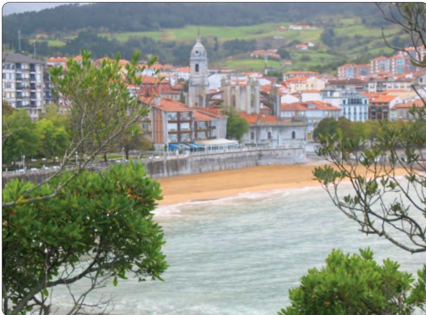
Le village de Lekeitio / Lekeitio herria.

Pour vous inscrire, contactez-nous au 05 56 45 03 05 ou par courriel : jean-marc.goyheneche@eskualetxea.org / bordeaux-bilbao2014@eskualetxea.org