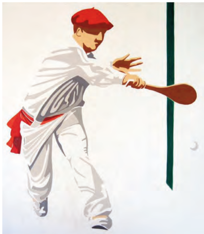
Reproduction d'une œuvre d'Éric Bourdon exposée à l'Eskual Etxea Eskual Etxean ikusgai den Éric Bourdon margolariaren obra baten kopia.

EB : Parce qu'une région est forte de ses traditions et c'est cette force qui me touche avec le plus d'intensité. Je n'ai pas la prétention de dire que j'ai saisi l'« âme basque ». Je la crois infiniment plus subtile et dans mes tableaux, je n'en aborde que la couche superficielle. Dans quelques années, si nous nous revoyons, j'espère pouvoir vous dire que j'ai progressé et que ma compréhension est maintenant plus fine... mais chaque chose en son temps !