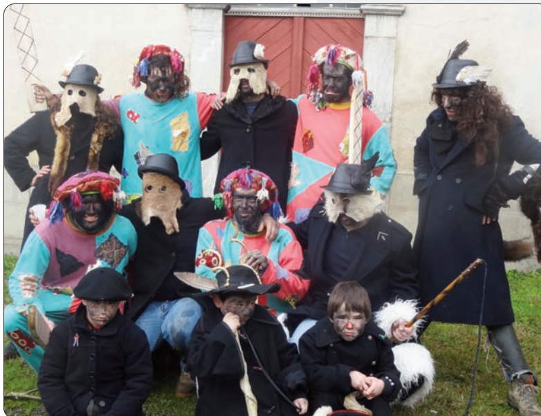
Les « noirs » et les « bohémiens » de la mascarade 2014 / Beltzak eta buhameak .

10.00etik 13.30ra barrikadak izaten dira. Horieta herriko dantza taldearekin herriko itzulia egiten dute, geldialdiak eginez zorbait lekuetan, nun herriko jendeek janari eta edariak emaiten dizkiete parte hartzaileeri. Horien truke dantzak eta bertsetak emanak dira; bestalde,