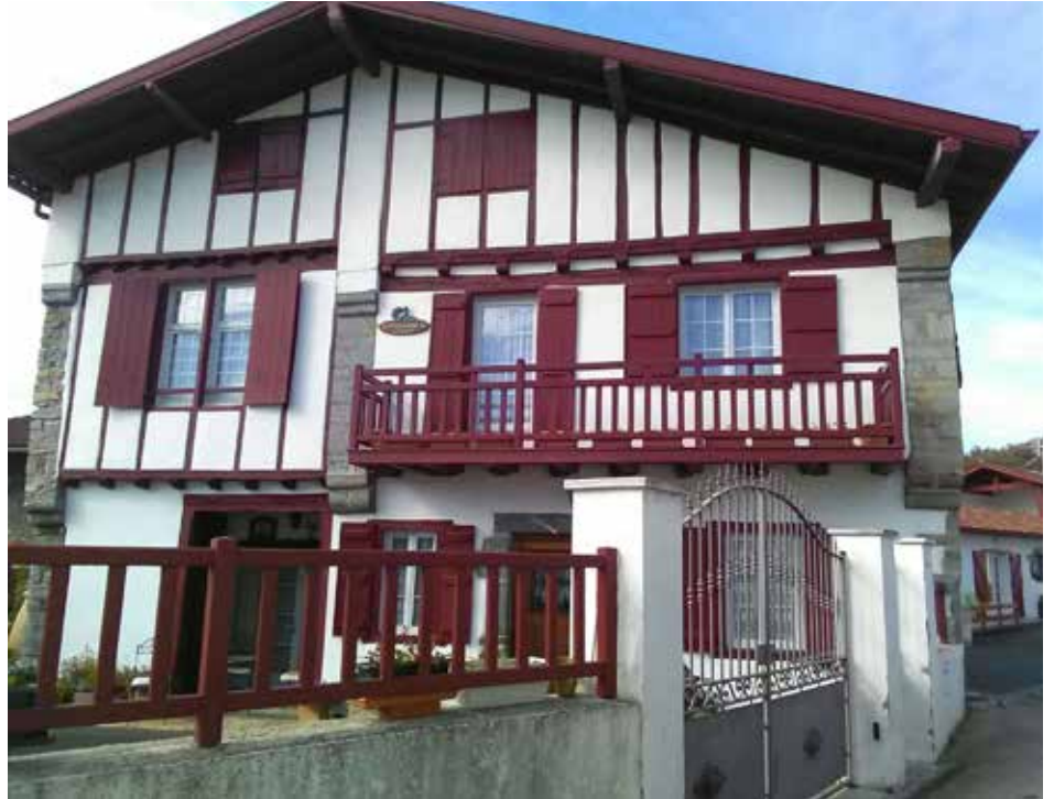
La maison Lissaraga du Bas-Cambo / Kanbo Beheko Lissaraga etxea

Section Lehengoa (D. Brulatout, L. Recarte) Itzulpena: Xabi Zuruturra