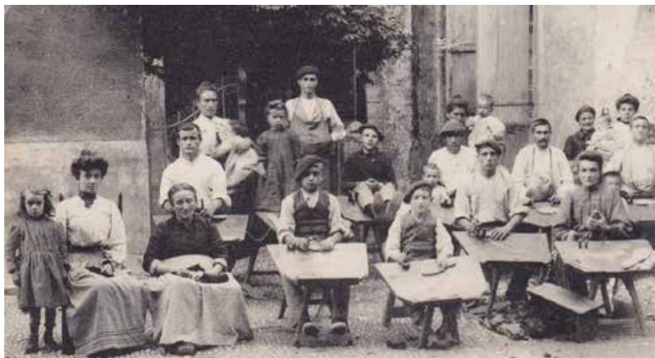
Des ouvriers sandaliers au Pays basque, début du XX e siècle / Euskal Herriko zapatagileak, XX. mendeko hasieran

** Texte intégral dans Agur n° 74 (mars 1966)