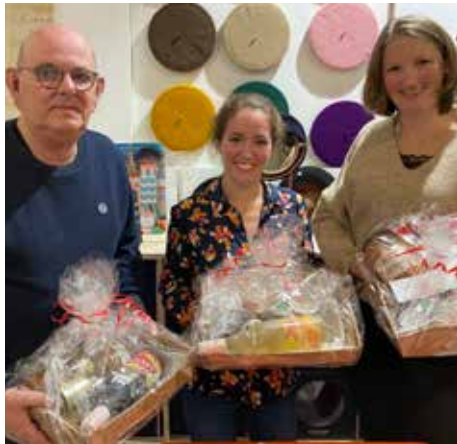
Les trois chanceux lors de la tombola du 3 décembre / Abenduaren 3ko zortedunak zozketan

Jusqu'où s'étendait le territoire de la langue basque sous l'Empire romain ? À quelles langues est apparenté le basque ? Combien de dialectes possède-t-il ? Quand a été publié le premier ouvrage en basque ? Autant de questions auxquelles ont dû répondre les participants à la soirée organisée vendredi 3 décembre. L'enjeu était de taille, car le quiz permettait à tous de participer à la tombola afin de gagner trois paniers garnis avec des produits de notre boutique. Durant le repas concocté par le chef d'OrestoBask, des petits intermèdes ont permis à tous de découvrir des proverbes basques et de se creuser la tête pour chercher des équivalents en français... qui n'existent pas toujours. Une belle soirée qui a permis d'associer réflexion, détente et bonne humeur !