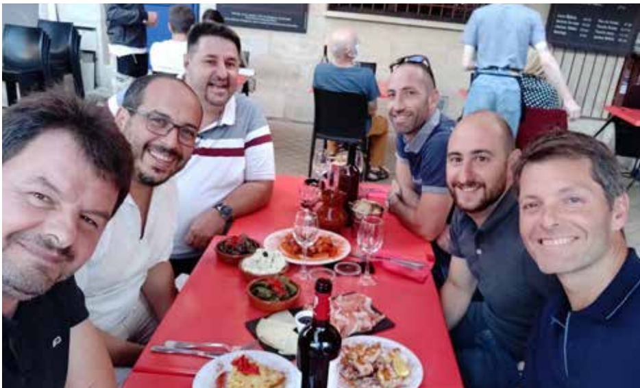
Quelques membres de Pilotariak présents lors du repas de reprise fin août 2021/ Pilotariak saileko kide batzuk, 2021eko denboraldiaren hasierako apairuan