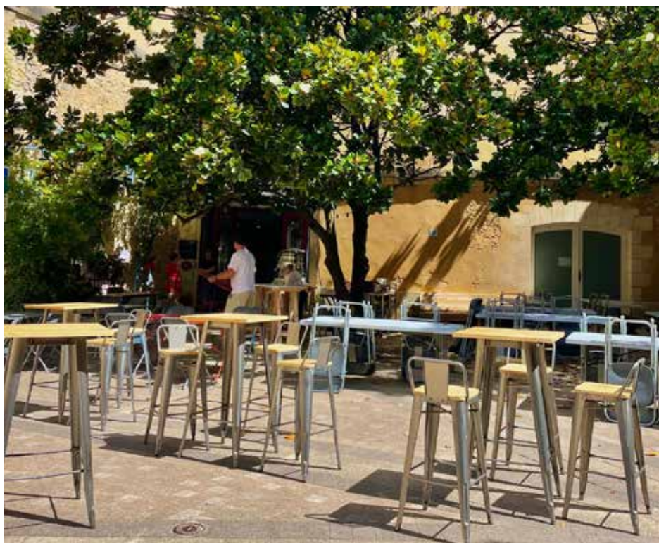
La terrasse d'OrestoBask, place des Basques / OrestoBask jatetxearen terraza, euskaldunen plazan

torisation n'est pas envisageable car la part du lucratif est prépondérante dans le budget global. Reste donc la filialisation via la création d'une société commerciale.