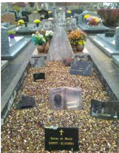
La tombe de la famille Dupuy-Elizondo à Cambo / Kanboko Dupuy-Elizondo familiaren hilobia