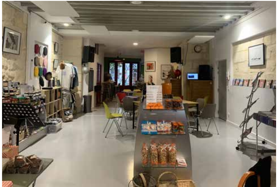
La boutique de la Maison Basque, entrée principale / Euskal Etxeko denda, sarrera nagusia

Zergen gaineko zerga, irabazi-asmorik gabeko eta irabazia duten jardueren banaketa Joanak gara jada Finacoop kabinetera zaharberitze aitzin proiektua ezartzeko, batik bat errentagarritasun baldintzak ezartzeko, OrestoBask ireki baino lehen. Oraingoan, gure elkartearen segurtasun